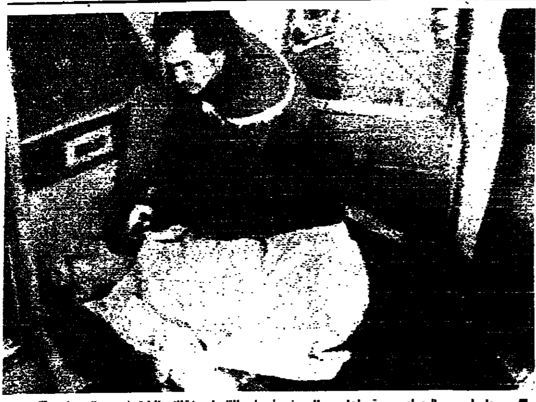
رجل أصيب بالرصاص وسقط على الرصيف أمام القنصلية الإسرائيلية في جوهانسبرغ